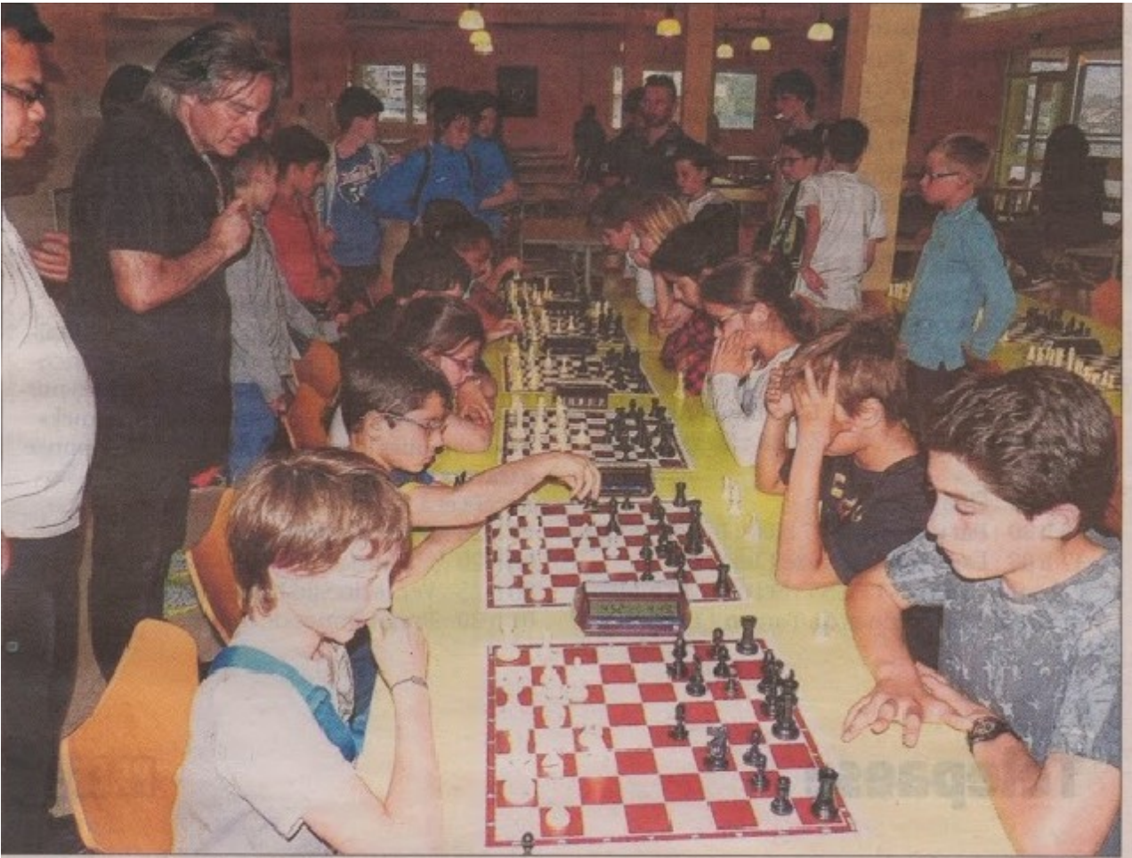
Les équipes de Giraud et de Saint-Paul se sont affrontées en finale de ce championnat de Corse des collèves.

P rès de 200 collèves ont participé cette année encore au championnat de Corse d'échecs, organisé par la ligue.