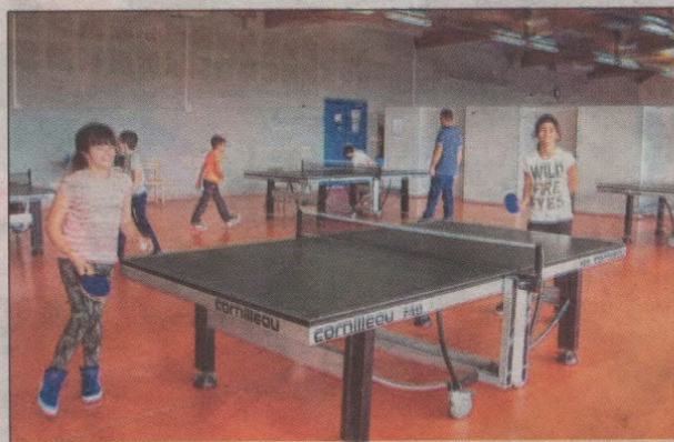
Le tennis de table prisé par les jeunes participants...