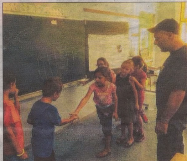
Intégré u programme, la morra rencontre un vif succès.