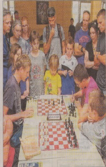
200 joueurs, petits et grands, accompagnés des parents, se sont retrouvés au lycée Pascal-Paoli de Corte pour disputer les finales du championnat de Corse d'échecs par équipe.