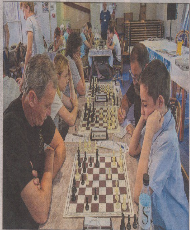
Onze grands maîtres et cinq maîtres sont présents jusqu'à vendredi soir à l'hôtel Marina Viva pour le 2 e Open International de Porticcio. L'occasion d'opposer l'élite insulaire à l'élite mondiale.

Rencontres diffusées en live "J'ai sélectionné les participants selon des critères de sportivité mais aussi en fonction de leur niveau de jeu", argumente Léo Battesti. Résultat des courses, onze grands maîtres et cinq maîtres sont présents. Un plateau exceptionnel qui est suivi