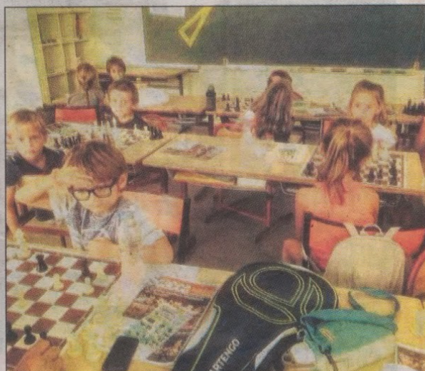
... tout comme les incontournables échecs.